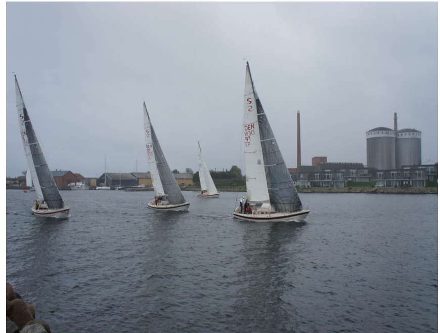
Lindholm Rundt 2016

Årets hovedkapsejlads afholdes lørdag d. 5. september. På grund af usikkerheden omkring reglerne vedrørende corona må vi vente med et endeligt program for dagen. Så snart vi har klarhed over evt. nye regler vil vi lægge programmet på hjemmesiden.