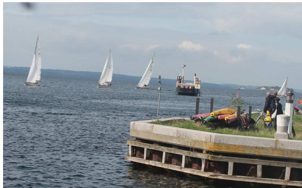
Lindholm rundt 2018

Vel mødt til en god kapsejladsdag med to ture rundt om Lindholm, i alt 18 sømil.